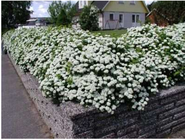
Spirea Betulifolia tor