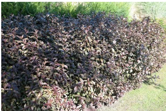
Weigela naomi Campbell