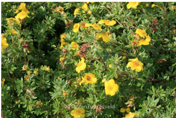
Potentilla Fruticosa darts golddigger