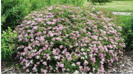
spirea little princes