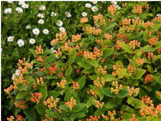
Hypericum orange gem