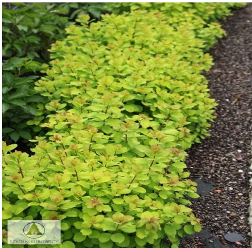
Spirea betulifolia Tor Gold