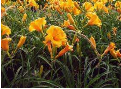
Hemerocallis Stella de oro