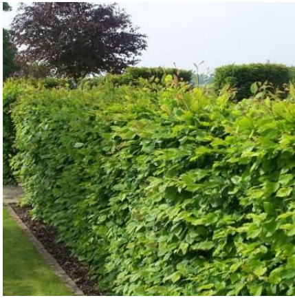
Carpinus betulus (haag)