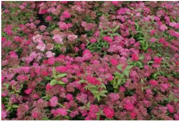
spirea japonica Dart's Red