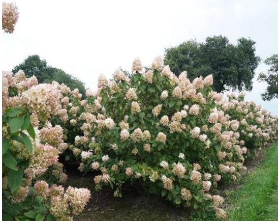
Hydrangea paniculate limelight