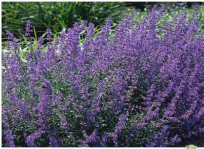
Nepeta Faassenii walkers Low