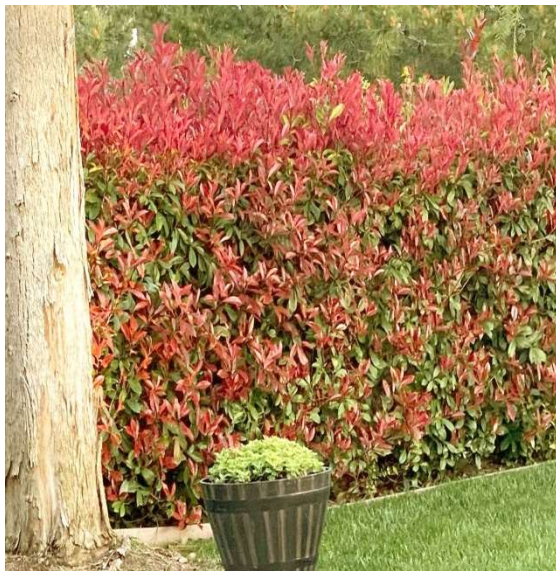
Photinia fraseri red robin