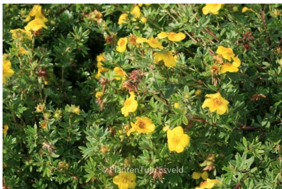
Potentilla fruticosa darts golddigger