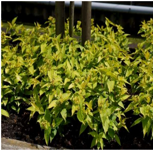
Diervilla Rivularis Honeybee