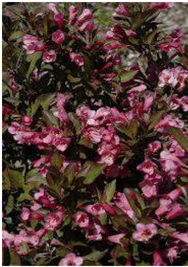
Weigela florida Samba