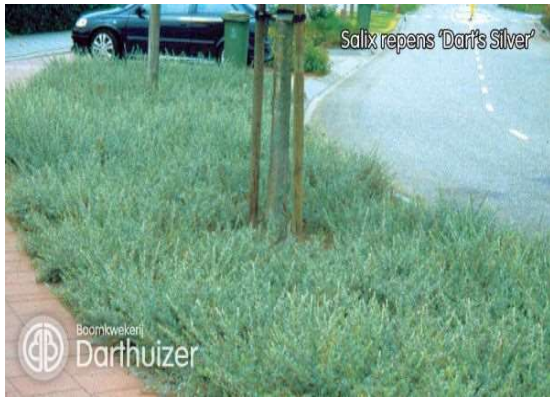
Salix repens Darts silver