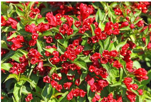
Weigela little red robin