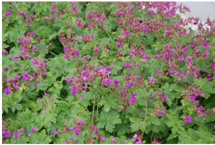
Geranium macrorrhizum Czakor