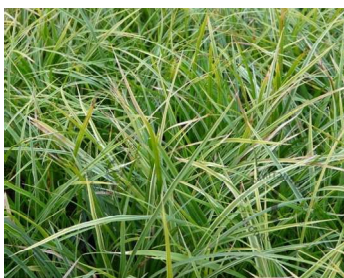
Carex morrowii variegata