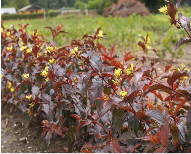
Diervilla Splendens Diva