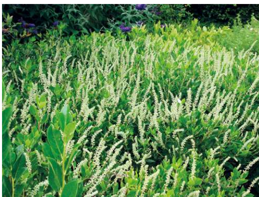
Clethra Alnifolia white spire