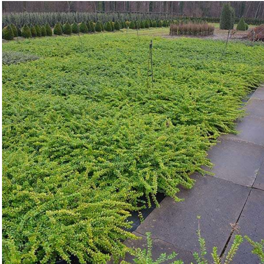
Lonicera nitida maigrun