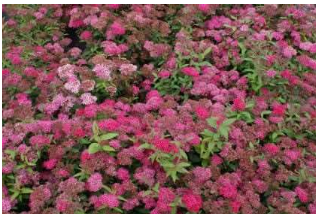
spirea japonica Dart's Red