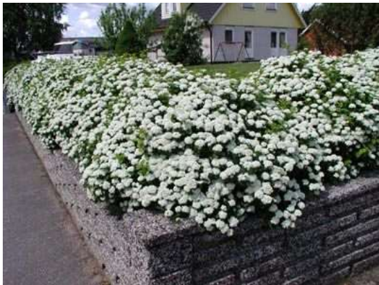
Spirea betulifolia tor