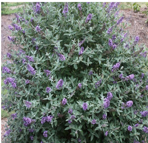
Buddleja Davidii Free Petite Blue Heaven