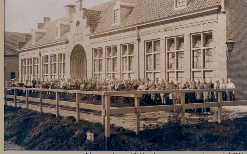
Opening R.K. Jongensschool 1924

Schenkelweg 4 is gebouwd in 1924 als Rooms Katholieke Jongensschool met vier klaslokalen. Het gebouw heeft tot 1985 dienst gedaan als schoolgebouw. Daarna is het herbestemd tot openbare bibliotheek.