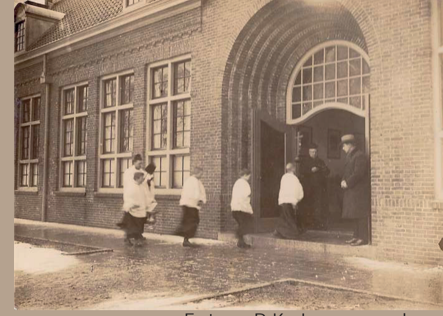
Entree R.K. Jongensschool omstreeks 1924

De school kreeg in 1955 de naam "St. Aloysius-school", vernoemd naar St. Aloysius, patroon van de Jeugd.