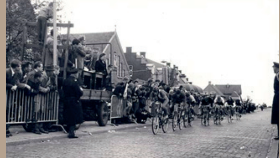
Wiellerronde van Zoeterwoude met op de achtergrond de St. Aloysius

Schenkelweg 4 is gebouwd in 1924 als Rooms Katholieke Jongensschool met vier klaslokalen. Het gebouw heeft tot 1985 dienst gedaan als schoolgebouw. Daarna is het herbestemd tot openbare bibliotheek.