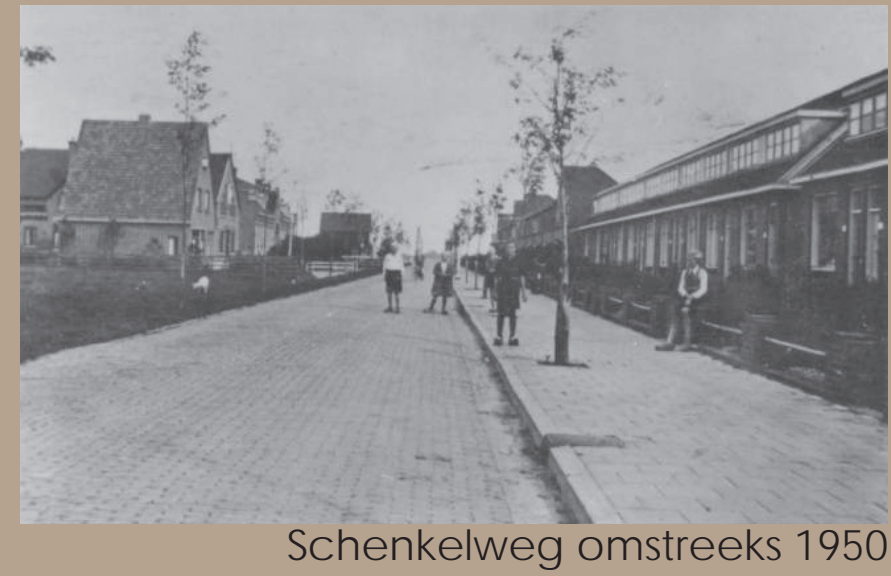
Schenkelweg omstreeks 1950

De Schenkelweg is één van de oudste straten van Zoeterwoude. Een levendige straat waar het dorpsleven zich vroeger afspeelde in het Patronaatsgebouw en de Rooms Katholieke Jongensschool.